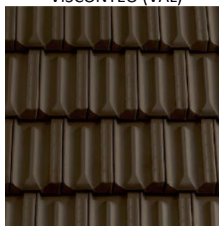
TESTA DI MORO (VAL)